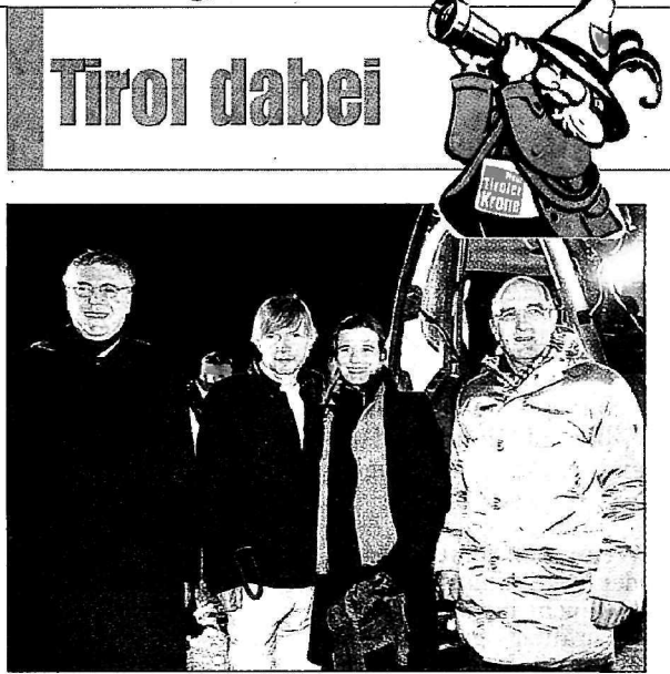
Fa. Prinoth präsentierte Pistenfahrzeug auf Seegrube